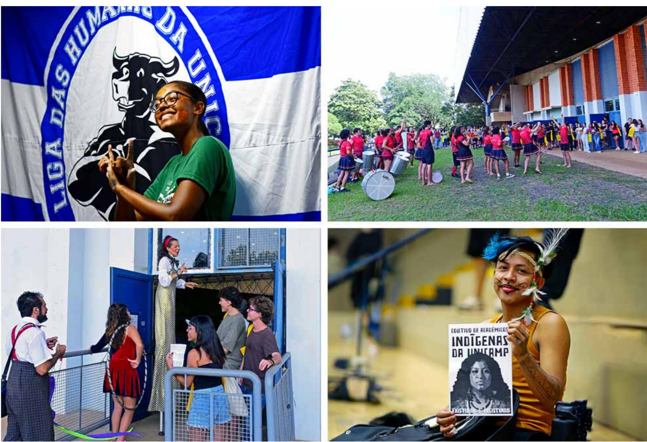
Várias atividades foram programadas para dar as boas-vindas aos calouros; programação da Calourada prossegue durante a semana nas faculdades e institutos

Mais um ano letivo teve início nesta quarta-feira (28), na Unicamp, com a Calourada 2024, evento organizado pela Pró-Reitoria de Graduação (PRG) e pela Pró-Reitoria de Extensão e Cultura (Proec), em que os alunos recém-chegados puderam conhecer um pouco dos serviços oferecidos pela Universidade, saber das iniciativas de esportivas, empresas juniores e coletivos acadêmicos, receber o kit ingresso e se apresentar aos colegas com quem vão dividir as salas de aula e a vida universitária pelos próximos anos. O evento teve início às 9h, no Ginásio Multidisciplinar da Unicamp (GMU).